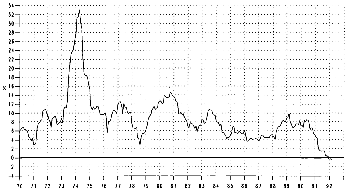
Rakennuskustannusindeksin 1964=100 vuosimuutos. 1970- Byggnadskostnadsindexens 1964=100 årsförändring 1970-