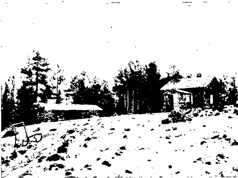
N:o 1. Työläisperheen asunto, rakennettu 50 vuotta takaperin, Jäppilän kunnassa. Kuvassa näkyy myös navetta ja rehvaja saman katon alla.