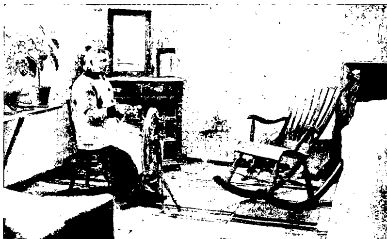
N:o 6. Työläisperheen asuinrakennus sisältä Raision kunnassa.