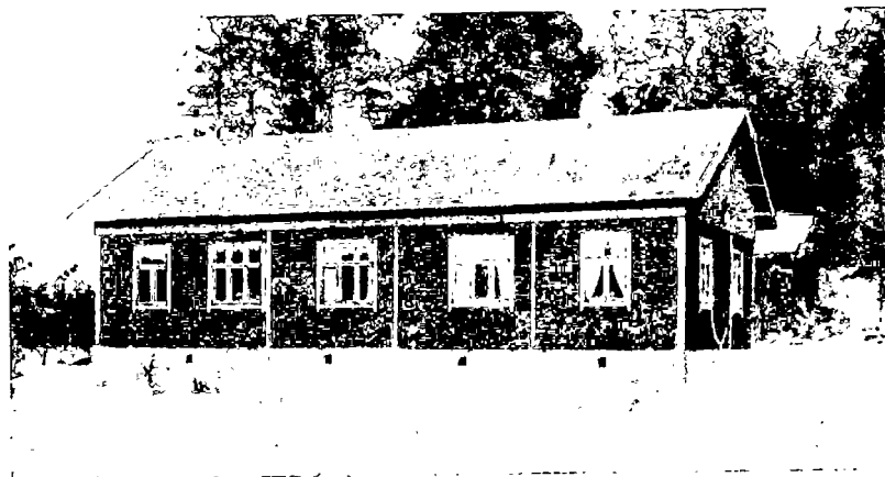
N:o 8. Asuinrakennus useampia työläisperheitä varten Raision kunnassa.