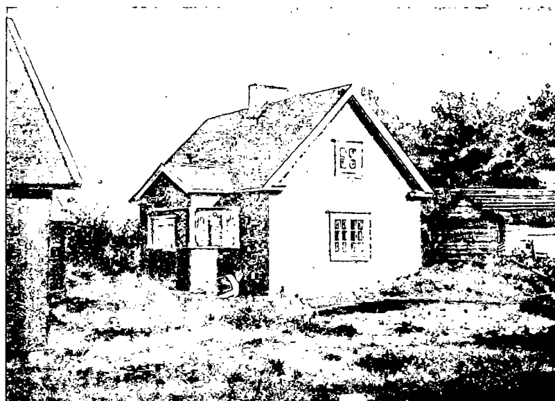
N:o 10. Työläisperheen asunto Porvoon kunnassa.