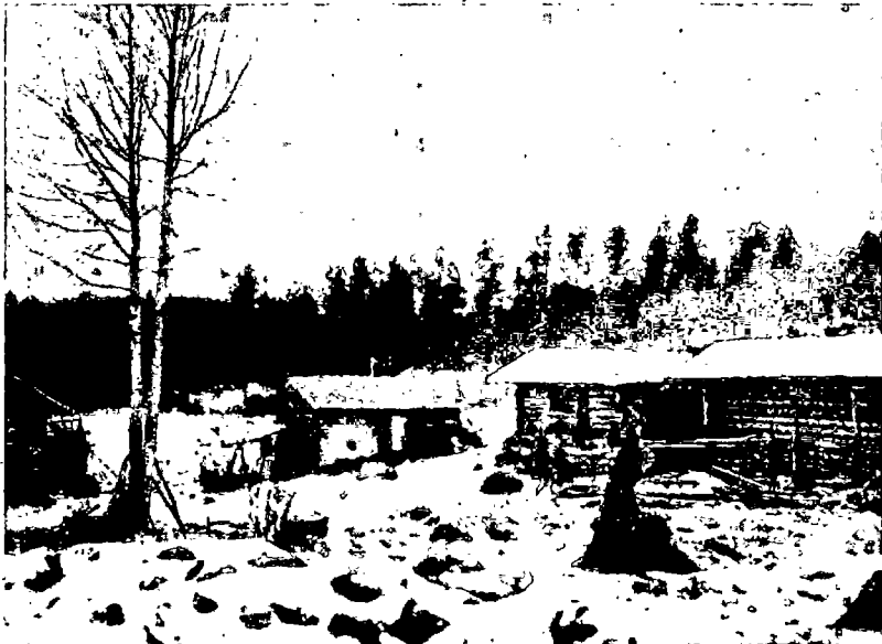
N:o 4. Työläisperheelle kuuluvia taloutrakennuksia: sauna, navetta ja rehovaja, Jäppilän kunnassa.