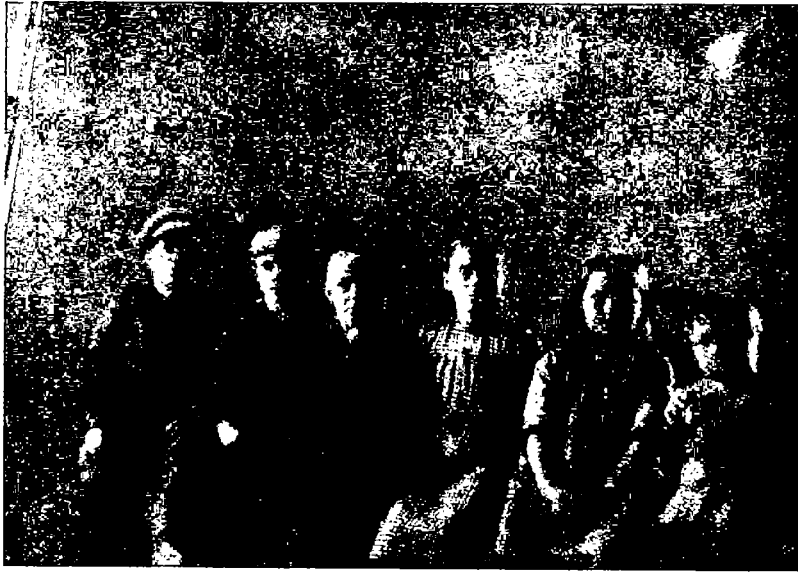
N:o 3. Osa edellä kuvatussa asunnossa elävän työläisperheen lapsista.