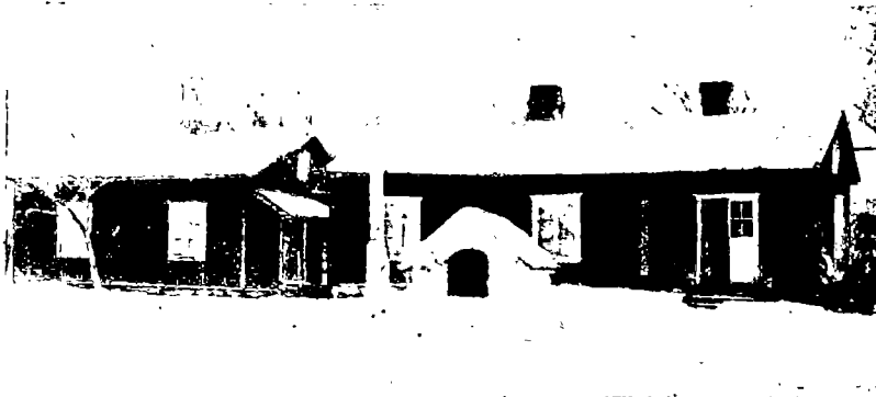
N:o 5. Työläisperheitten asuinrakennuksia Raision kunnassa.