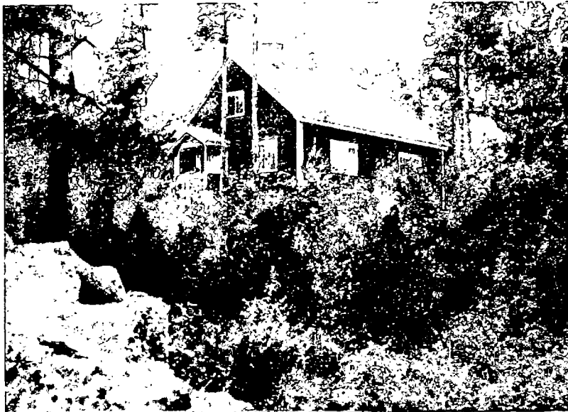
N:o 12. Kahden työläisperheen asunto Inkoon kunnassa.