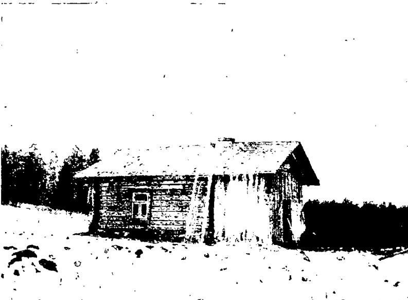
N:o 2. Työläisperheen asunto, rakennettu 30 vuotta takaperin, Jäppilän kunnassa.