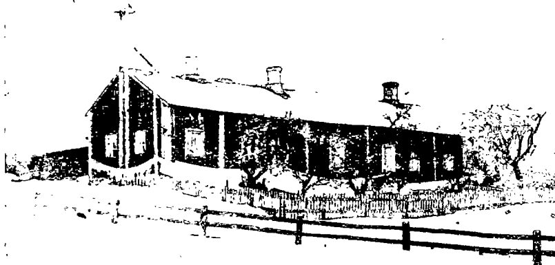
N:o 7. Asuinrakennus useampia työläisperheitä varten Raision kunnassa.