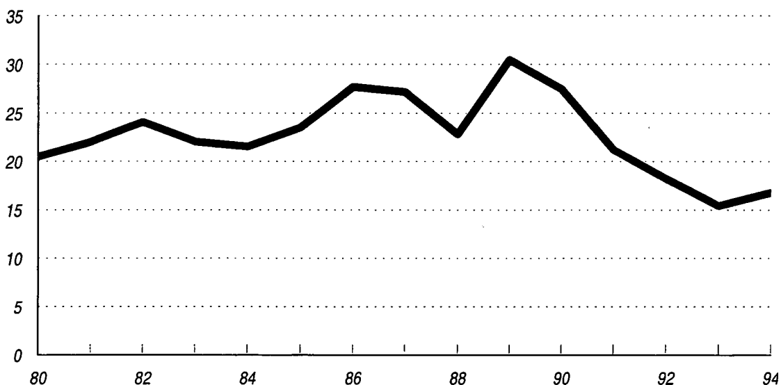
Teollisuuden (C; D; E) investoinnit vuosina 1980 - 1994 (miljardia markkaa, v. 1990 hinnoin)

Investointimenot on teollisuustilastossa ilmoitettu aineellisen käyttöomaisuuden hankintamenojen ja aineellisen käyttöomaisuuden myynnistä saatujen tulojen erotuksena.