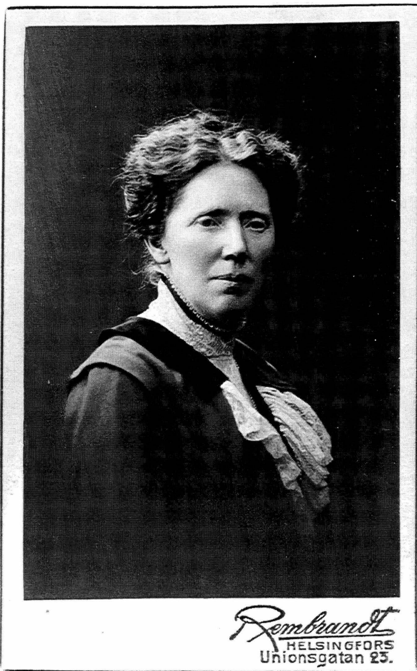
Tekla Johanna Virginia Hultin (1864–1943).